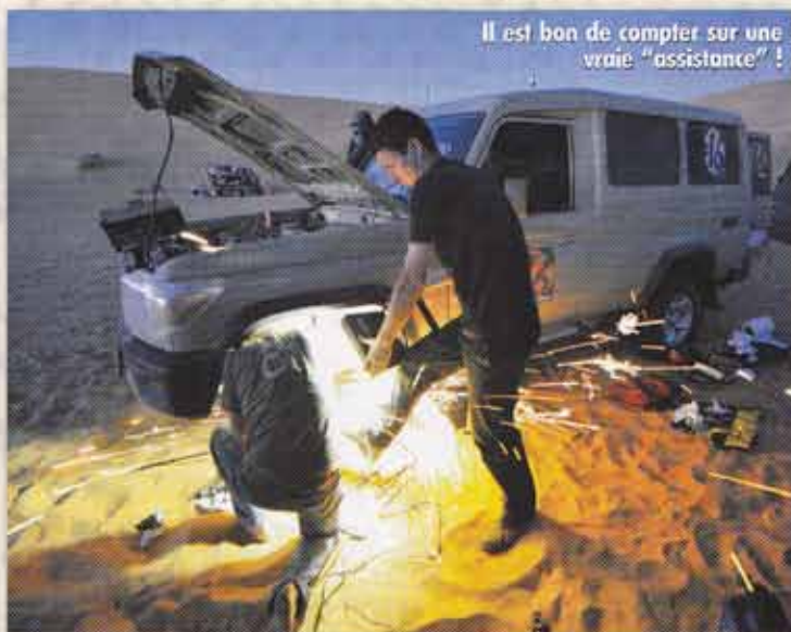
Il est bon de compter sur une vraie "assistance" !

Bien que nécessaire (toutes les bonnes choses ont, hélas, une fin !) le retour vers le Nord a commencé par à travers des cultures étonnamment vertes dans ces zones désertiques grâce au pompage de l'eau dans les nappes phréatiques, puis sur de longs amadas. Sur les pistes de ces plateaux, on peut se servir des pierres taillées en forme de pyramide comme