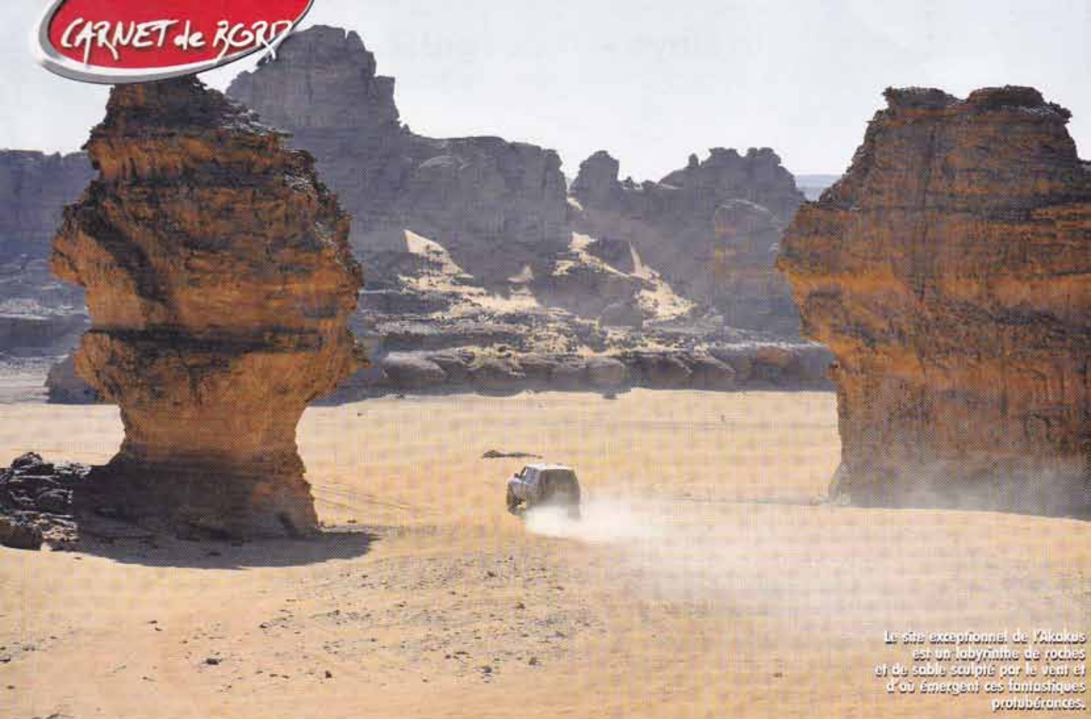
Le site exceptionnel de l'akakus est un labyrinthe de roches et de sable sculpté par le vent et d'où émergent ces fantastiques protubérances.

éclairée par les lueurs des étincelles de la meuleuse au coucher du soleil, permettant ainsi de continuer dès le lendemain l'aventure sans encombre. Cette convivialité était aussi bien présente pour le nouvel an et nous a permis de commencer au mieux l'année 2010 : que demander de plus qu'un groupe soudé dans un décor de rêve sous une nuit étoilée, avec un menu à faire pâlir certains restaurants ? Jugez plutôt ! Foies gras, magrets de canard, champagne frais, desserts de qualité, avec entre autres des crèmes glacées sont tombés dans nos assiettes ! Et le tout magnifiquement couronné par un feu d'artifice tiré rien que pour nous ! Les mots "bivouac", "plaisir" et "gastronomie" ne sont pas nécessairement incompatibles, bien au contraire ! C'était du sable, des bulles et des étoiles !