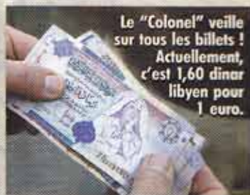
Le "Colonel" veille sur tous les billets ! Actuellement, c'est 1,60 dinar libyen pour 1 euro.