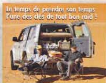
Le temps de prendre son temps l'une des clés de tout bon raid !