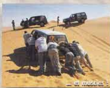
... et muscles !

Fond de cinq, liberté absolue, loin de toute contrainte... Tout pour le plaisir !