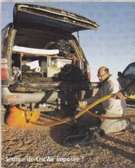
Séance de Cric'Air imposée !